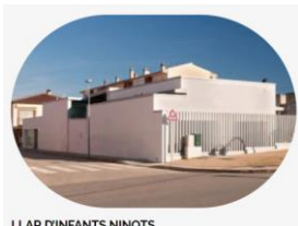
LLAR D'INFANTS NINOTS